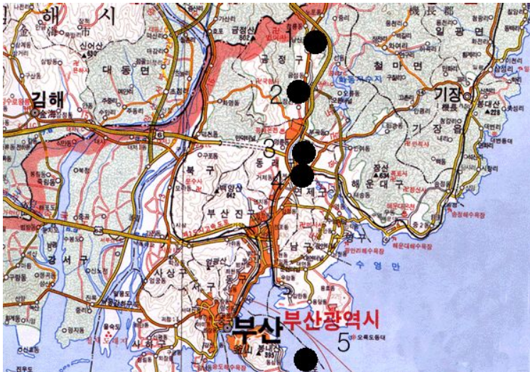
1. 노포동유적 2. 구서동유적 3. 북산동유적 4. 동래폐총 5. 조도폐총

이러한 삼한·삼국시대의 대외문물교류관계를 볼 수 있는 출토유물 상황은 초기에는 中國系·倭系·北方系 등이 동시에 나타나지만 후기로 갈수록 倭에 집중된다. 이러한 현상은 漢郡縣의 멸망에 따른 것으로 이해되지만 왜와 변한지역의 밀접성은 이후 삼국시대 가야세력이 멸망할 때까지 지속되었다.